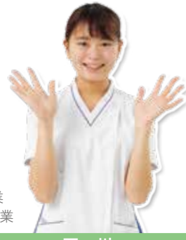
2018年卒業 佐久大学卒業