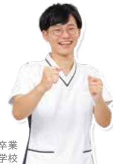
2017年卒業 横浜実践看護専門学校