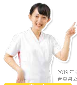
2019年卒業 青森県立保健大学卒業