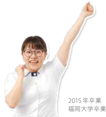
2015年卒業 福岡大学卒業

川崎市立病院で活躍する先輩をご紹介します。 令和5年9月現在の在職者の出身校一覧です